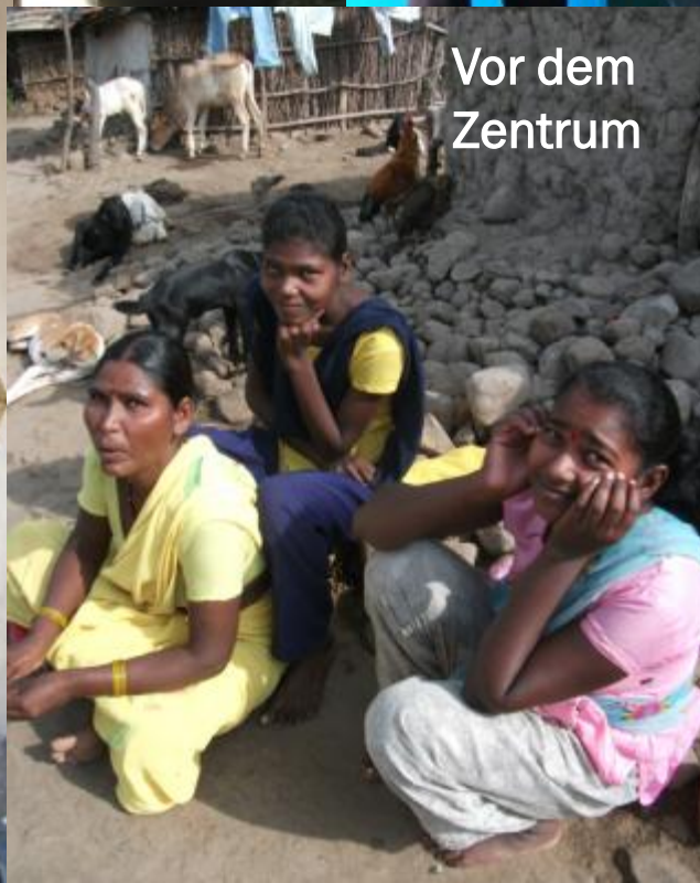
Vor dem Zentrum