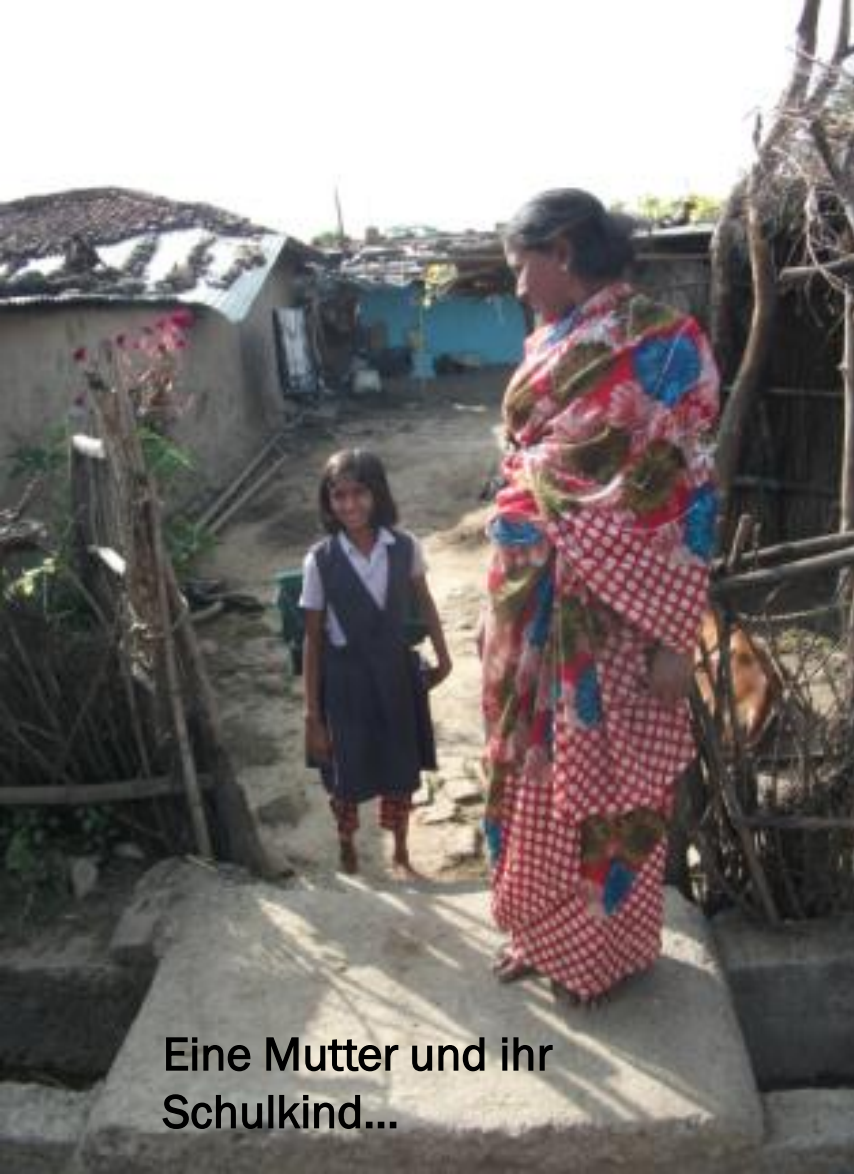
Eine Mutter und ihr Schulkind...