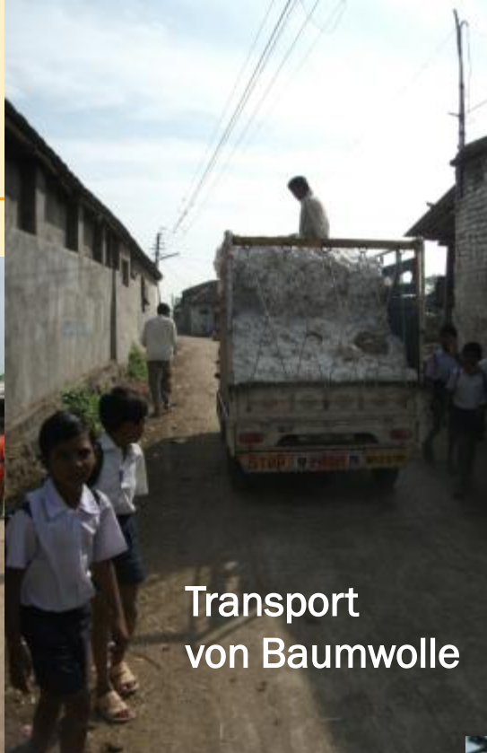
Transport von Baumwolle