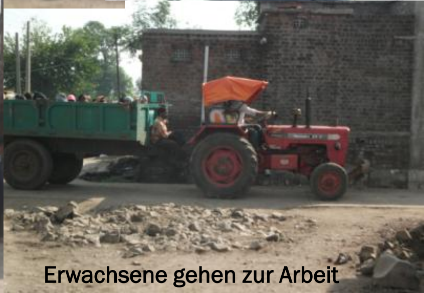
Erwachsene gehen zur Arbeit