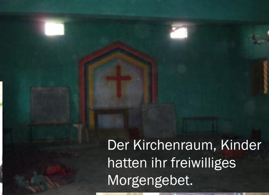
Der Kirchenraum, Kinder hatten ihr freiwilliges Morgengebet.