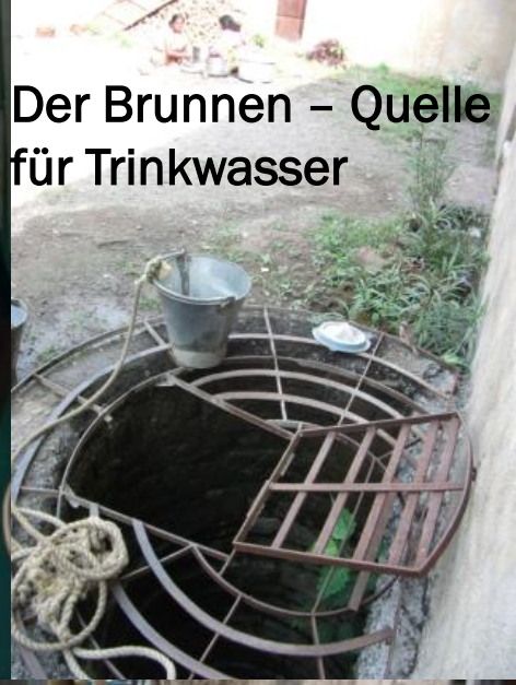
Der Brunnen – Quelle für Trinkwasser