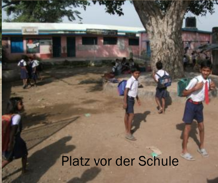
Platz vor der Schule